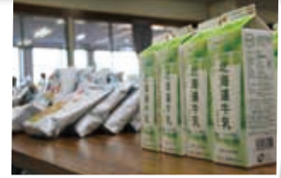
期間中の食事は（株）セイコーマートさんから提供していただきました