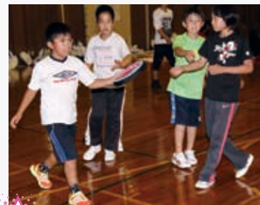
5 ドッチビー盛り上がりました！