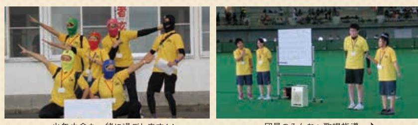
少年大会も一緒に過ごします！！ 団員のみんなへ歌唱指導～

北海道リーダー会は年間を通して多くの事業を実施しています。レクリエーションやスポーツ活動などの体を動かすことや、ディスカッションやグループワークといった頭を使うことなど、幅広く活動しています。文化系であり体育系系でもある、つまり体育系系の中の文化系系なのです！ 私たちはこれらの活動を通して全道・全国で活躍し、そこで多くの人に出会い、多くの友達ができ、学校や部活動では学ぶことのできないことをたくさん経験しています。