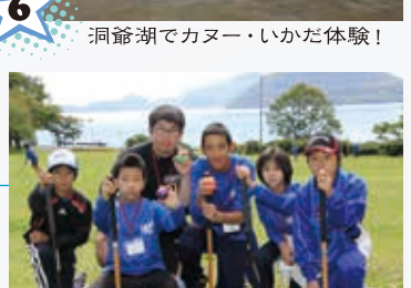
7 パークゴルフもしました！