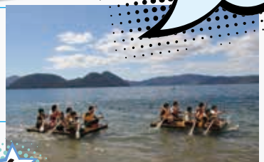
6 洞爺湖でカヌー・いかだ体験！