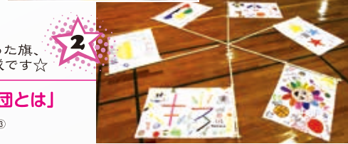
2 みんなで作った旗、完成です☆