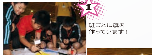
1 班ごとに旗を作っています！