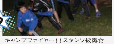
9 キャンプファイヤー！！スタンプ披露☆