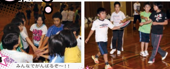
4 みんなでがんばるぞー！