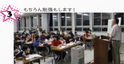
3 もちろん勉強もします！